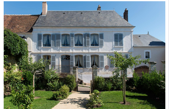
La Maison Colette