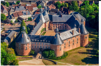
Le Château de Saint-Fargeau