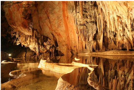
Les Grottes d'Arcy-sur-Cure