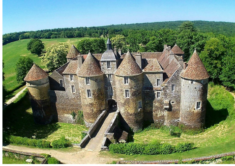
Le Château de Ratilly