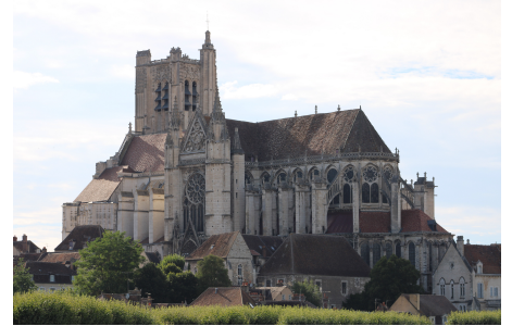
La Cathédrale Saint-Etienne à Auxerre