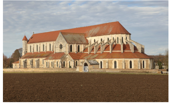
L'abbaye de Pontigny