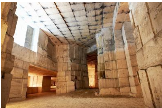
La Carrière d'Aubigny