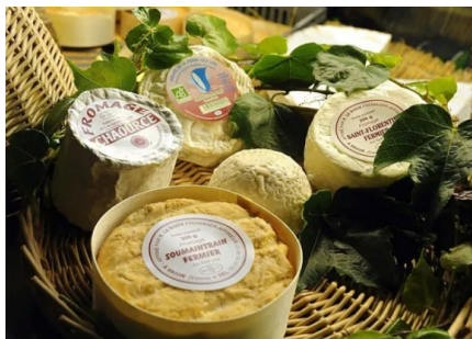
Un plateau de fromage typique de l'Yonne