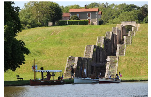
Les Sept Écluses de Rogny