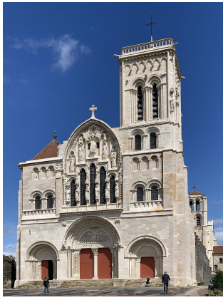
La Basilique de Vézelay