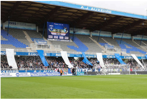
Le Stade Abbé-Deschamps