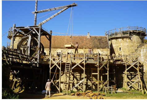
Le chantier de Guédelon