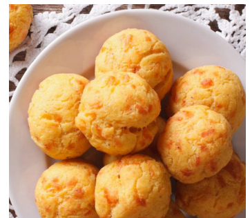
La gougère bourguignonne